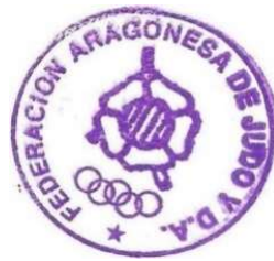
Fdo.- RAÚL CLEMENTE SALVADOR